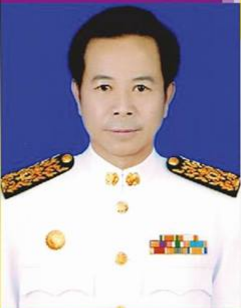
นายชวง กะกัน นายกเทศมนตรีตำบลสถาน