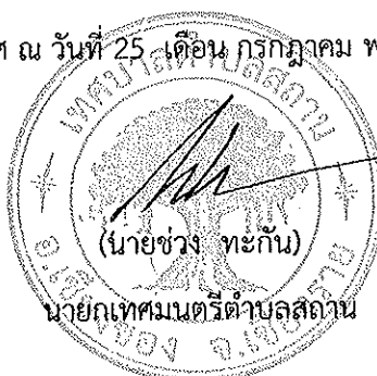
(นายช่วง ทะกัน) นายกเทศมนตรีตำบลสถาน

ประกาศ ณ วันที่ 25 เดือน กรกฎาคม พ.ศ. 2562